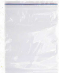
Diepvrieszakjes (hersluitbaar of met zip-loc is makkelijk)