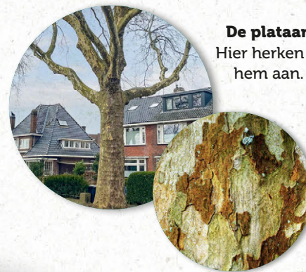
De plataan Hier herken je hem aan.

Urgenda Plataancheck Nicolaes Maesstraat 2 1506 LB in Zaandam