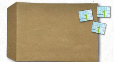
Grote envelop en voldoende postzegels